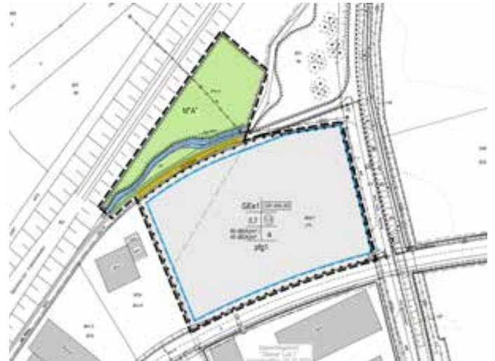
Ausschnitt Bebauungsplan „Oberer Luß I – 1. Änderung“ vom 23.03.2020/05.07.2021/15.11.2021, unmaßstäblich, genordet

Der Geltungsbereich ist gemäß Aufstellungsbeschluss vom 23.03.2020 in dem Lageplan des Ing.-Büros WASSERMÜLLER ULM GmbH vom 23.03.2020/05.07.2021/15.11.2021 festgelegt.