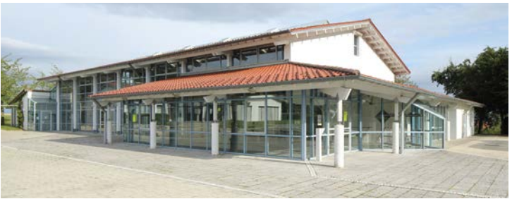
Birkenlauhalle im Stadtteil Ringingen Blaubeurer Straße 70, 89155 Erbach-Ringenen