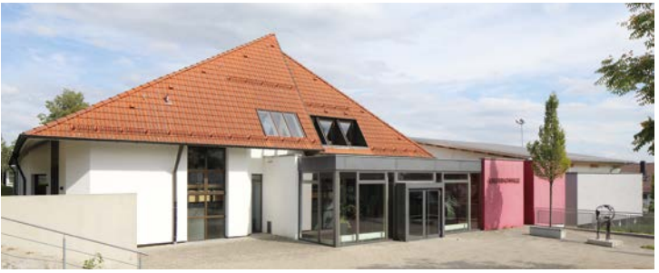
Erlenbachhalle mit Rondell im Schulzentrum Erbach Jahnstraße 30, 89155 Erbach