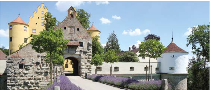
Schloss Erbach und die katholische Kirche St. Martinus sind auf dem Schlossberg schon von weitem als höchster Punkt des Ortes sichtbar. Die Adresse ist Schlossberg 1, 89155 Erbach