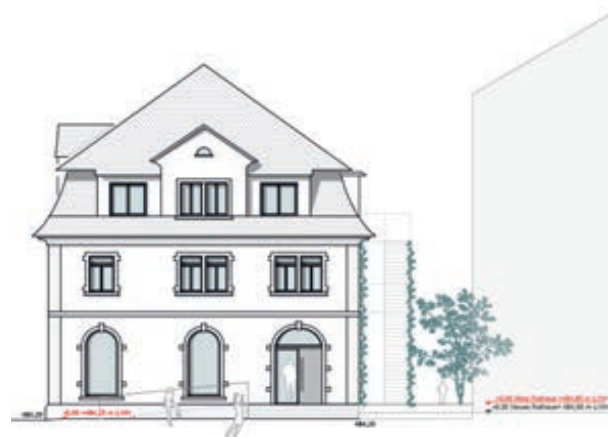
Skizzen von hochstrasser. gesellschaft für architektur mbh

Ein wichtiger Bestandteil der Planung sind die bodentiefen Fenster, die viel Licht in die Räume lassen und die Verbindung zwischen Innen- und Außenbereich stärken. Im Erdgeschoss wird eingroßzügiger Aufenthaltsbereich entstehen, der zum Verweilen, Lesen und Austauschen einlädt. Die Medienbereiche sind in den oberen Stockwerken vorgesehen.