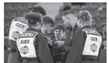
Bild 3 das deutsche Team vor dem Entscheidungskampf um Bronze