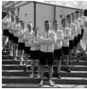
Bild das Deutsche Team