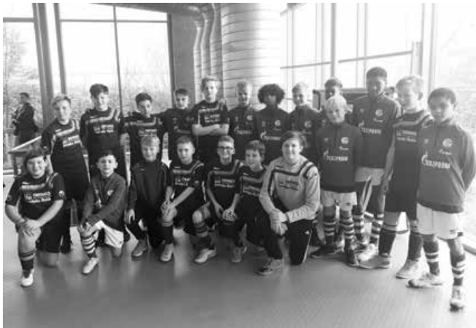
U13 SGM Ringingen/Pappelau-Beiningen und Schalke04