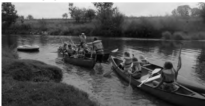
Für alle Kinder und Betreuer war es ein toller Ferientag. BUND - Ortsgruppe Erbach

Um 16 Uhr war es dann leider schon wieder zu Ende, denn die Zeit ist im Nu vergangen.