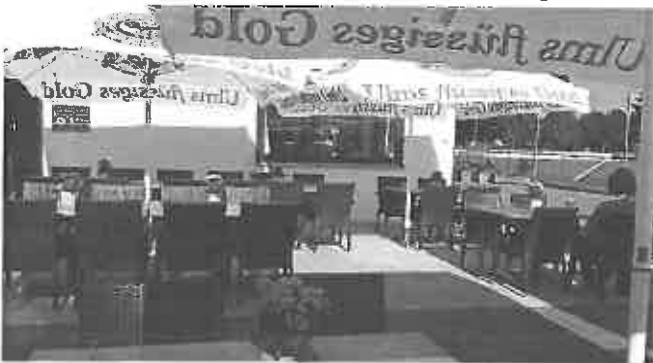
Die neu gestaltete Gartenwirtschaft

Nach gut zwei Wochen ist die Neugestaltung der Gartenwirtschaft von unserem Vereinslokal im Donauwinkel erfolgreich abgeschlossen.