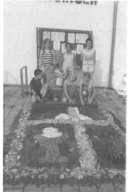
Blumenteppeich der Kommunionkinder

Herzlichen Dank an alle Blumenspender. Eure Gruppenleiterinnen