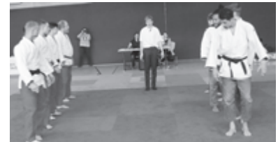
die Erbacher Aufstellung rote Hose gegen Ravensburg