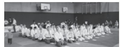
Siegerehrung und Mannschaftsfoto