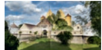
Stadtbücherei Erbach (Donau) Fotoausstellung 8. 2. - 21. 3. 2024

Anmeldung erwünscht! In der Regel ist jedoch genügend Platz, so dass auch spontane Besuche ohne Anmeldung möglich sind.