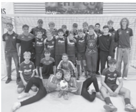
C-Jugend Turniersieger in Erbach