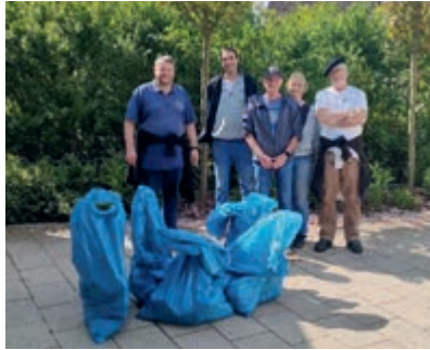
Ein Teil der engagierten Helferinnen und Helfer.