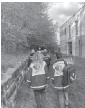
Übung mit der Jugendfeuerwehr Erbach

Gerne laden wir alle interessierten Kinder und Jugendliche ein vorzubekommen und freuen uns über neue Gesichter.