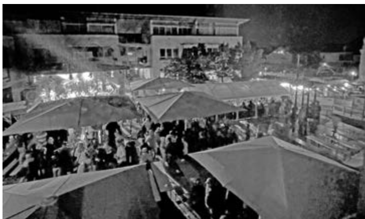
Achim Gaus Bürgermeister