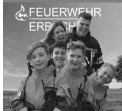
Komm auch Du zur Feuerwehr!