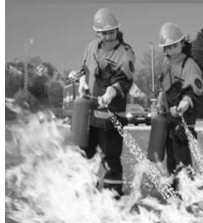
Löschübungen am Firetrainer