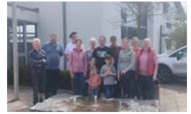
–Ein Teil der engagierten Helferinnen und Helfer.–