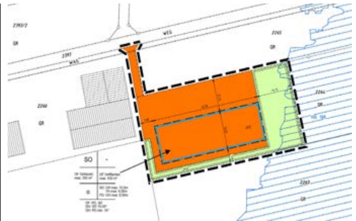
Ausschnitt Bebauungsplan „Sondergebiet Hangelenbach – Neubau eines Schuppens“ vom 21.11.2022, unmaßstäblich, genordet

Im Einzelnen gelten für den Entwurf des Bebauungsplanes und der örtlichen Bauvorschriften die Planzeichnung, die textlichen Festsetzungen (planungsrechtlicher Teil) und die örtlichen Bauvorschriften mit Begründung und Umweltbericht des Ingenieurbüros WASSERMÜLLER ULM GmbH mit dem Datum vom 19.10.2020/21.11.2022 sowie das Artenschutzgutachten des Bio-Büros Schreiber vom 01.05.2021.