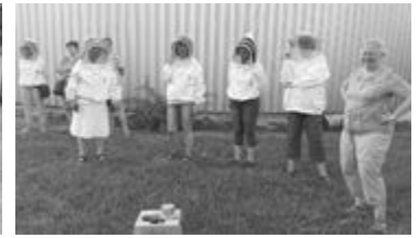
Alle in Montur