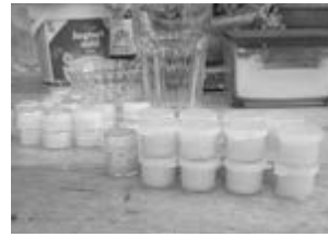
Jede Menge Lippenbalsam