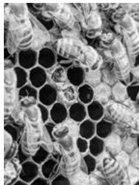
Neue Bienen schlüpfen