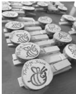
Belohnung für die fleißigen Helfer

war das Ergebnis der Müllsammelaktion, die am vergangenen Samstag in und um den Ort stattgefunden hat. 7 gelbe Säcke, 5 Säcke Restmüll, Alteisen und jede Menge Glas kamen am Ende des Tages zusammen! Viele Kinder, zum Teil auch ohne Eltern, hatten sich an dieser Aktion beteiligt. Sie waren mit Feuereifer bei der Sache, hatten Spaß dabei und waren auch sehr interessiert, als sie ihre Ausbeute an der Sammelstelle auch noch trennen und sortieren durften. Die größeren unter ihnen konnten sich zudem auch an den Infowaben zum Thema Müll informieren. Als Dankeschön bekam jedes Kind eine süße Biene aus Hefeteig und eine Auszeichnung in Form einer fleißigen Biene auf einer kleinen Wäscheklammer zum Befestigen an der Kleidung. Von den Eltern bekamen wir rundum positives Feedback. Herzlichen Dank an all die fleißigen Bienchen und den Familien, der Bäckerei Seemann für das Backen der leckeren Belohnung und der Gemeinde für das Bereitstellen der