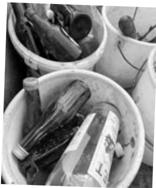
Warum liegen Flaschen im Gebüsch?