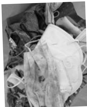
Ein Bruchteil der Ausbeute

Kinderhandschuhe und Müllzangen und die Übernahme der Kosten für das süße Gebäck! Nicht zu vergessen natürlich all diejenigen, die die ganze Aktion geplant und organisiert hatten!