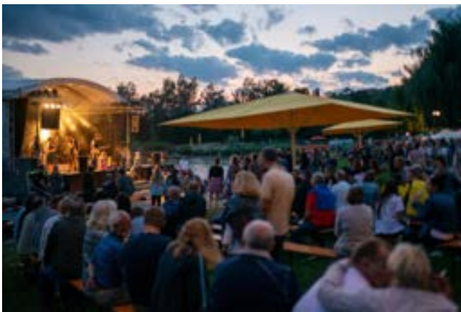
Die Stadtgeburtstagsparty Erbach muss leider abgesagt werden (Bild von 2019).

Abgesagt werden muss leider auch das etablierte Konzert mit der Rockband Helter Skelter, die geltenden Auflagen ermöglichen derzeit kein Rockkonzert in der gewohnten Form.