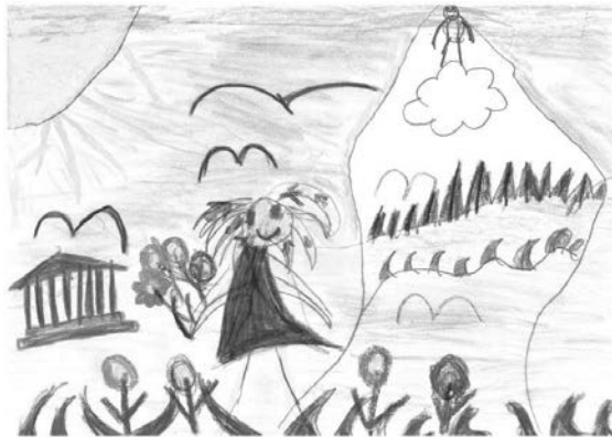
Kategorie I: bis 6 Jahre Leon Kast 5 Jahre

Auch dieses Jahr konnten Kinder und Jugendliche aus Erbach und den Teilgemeinden ihr malerisches Können unter Beweis stellen