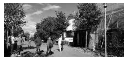
Der neue Aufzugschacht wird geliefert