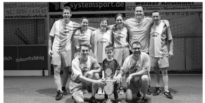
Sieger Hobby: "SVR Ausschuss"