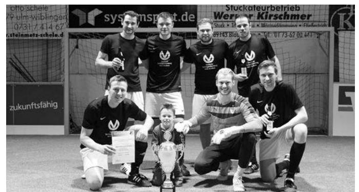
Sieger Aktive: "Hoba Crew"