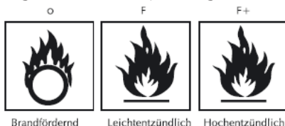
Brandfördernd Leichtentzündlich Hochentzündlich

Wichtiger Hinweis: Nicht ausgehärtete lösungsmittelhaltige Altfarben und Klebstoffe müssen nach wie vor beim Problemstoffmobil abgegeben werden. Diese sind auf ihrer Verpackung durch folgende Gefahrensymbole gekennzeichnet: