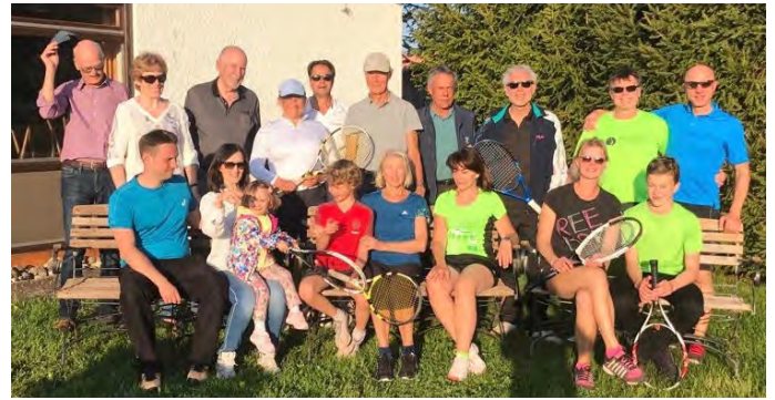
Saisonöffnung des TC Erbach bei strahlendem Sonnenschein