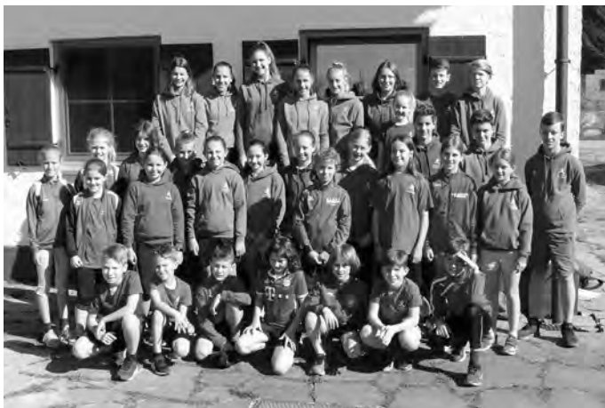
Abteilung Ski-Club www.tsv-erbach.de/skiclub

Nur mit dem Engagement von euch allen ist es möglich, solch ein Trainingslager durchzuführen – DANKE!