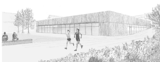
Bild: Aus dem Entwurf von DREI ARCHITEKTEN Süd-ansicht des Gebäudes