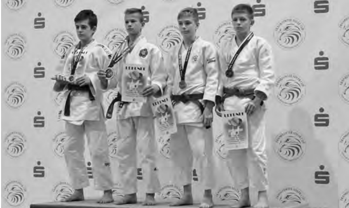
2. Von li mit Gold

le sowie zwei Fünften und einem 7. Rang rundeten die erfolgreiche Herbstsaison der jungen Judoka des TSV Erbach zur Zufriedenheit der gesamten Abteilung ab.