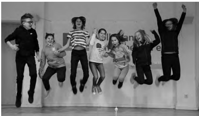
Nach der gelungenen Vorstellung.