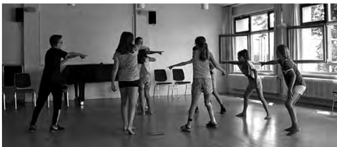
Im Sommer während des Ferienprogramms.

Gerne möchten wir das Ganze fortführen. Auch die Kinder möchten weitermachen. Es ist angedacht einmal im Monat oder auch wieder in den Ferien, Workshops für Kinder anzubieten. Interessenten können sich gerne über unsere Homepage www.tsv-erbach.de/kontakt/melden .