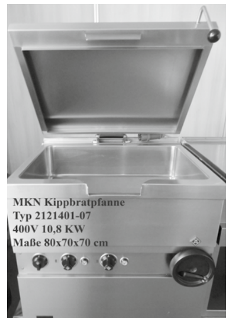
MKN Kippbratpfanne Typ 2121401-07 400V 10,8 KW Maße 80x70x70 cm