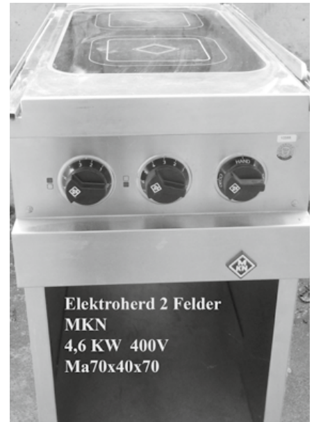
Elektroherd 2 Felder MKN 4,6 KW 400V Maße 70x40x70