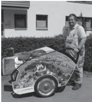
Unterwegs für ein sauberes Erbach