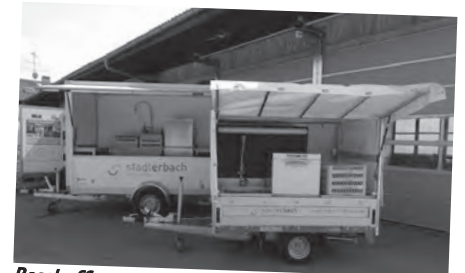
Beschaffung zweites Spülmobil