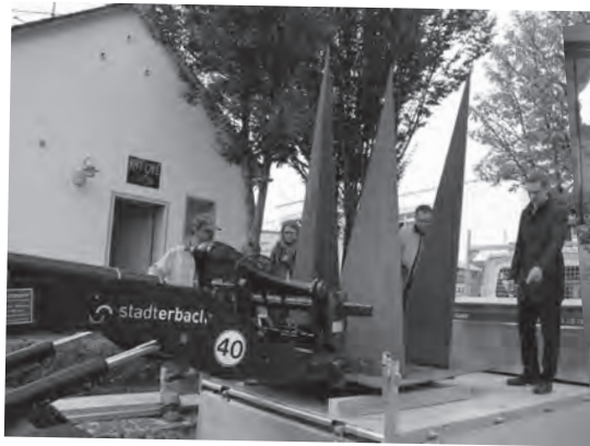
Umbau Bürgertreff Auf der Wühre