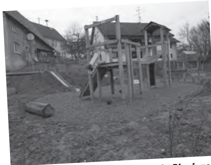
Neuer Spielplatz am Kindergarten in Ringingen