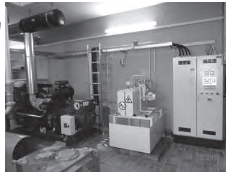
Neue Notstromanlage auf der Kläranlage