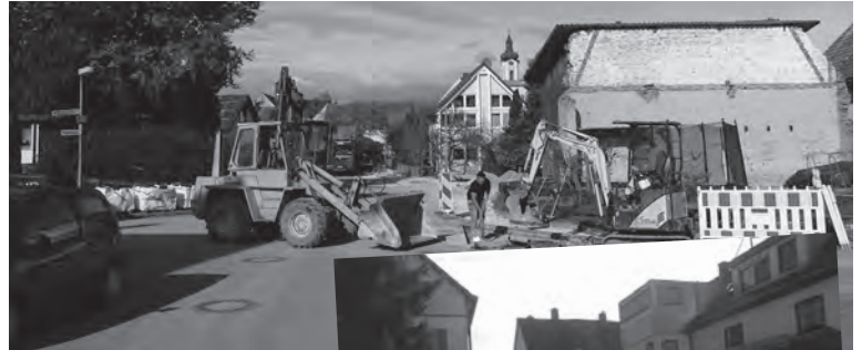
Sanierung Wasserturmweg Dellmensingen