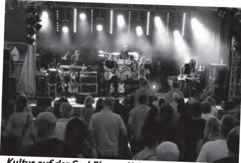
Kultur auf der Seebühne – Helter Skelter