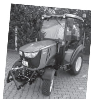
Neuer Kommunaltraktor für die Kläranlage