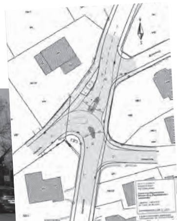
Sanierung Ziegeleistraße Erbach