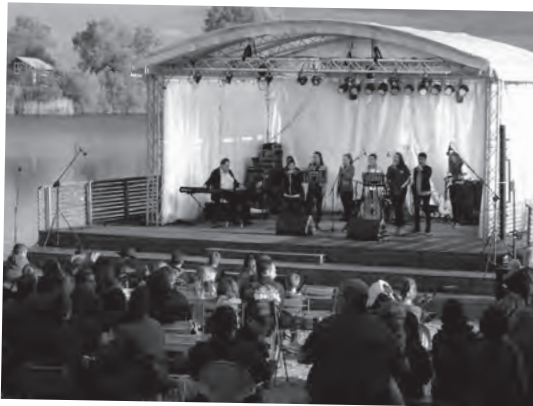
Kultur auf der Seebühne – Bunter Abend