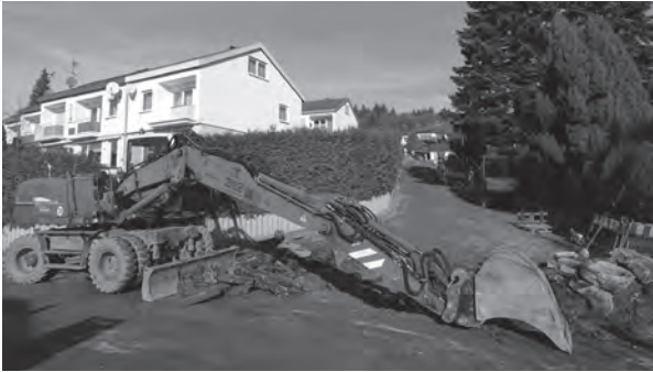
Sanierung Sonnenhalde Bach