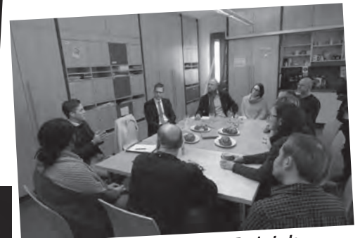
Besuch MdL Manuel Hagel in der Realschule