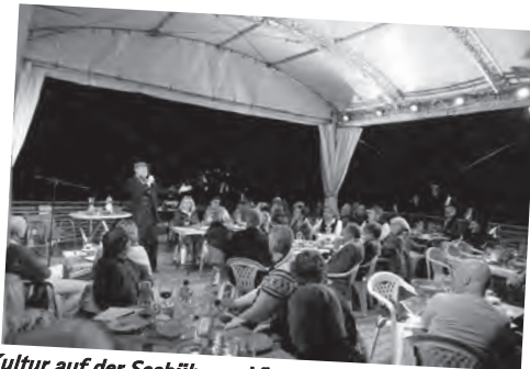
Kultur auf der Seebühne – Vino sul Lago