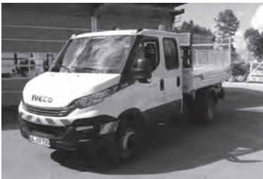
Neues Pritschenfahrzeug Bauhof