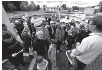
Tag der offenen Tür auf der Kläranlage