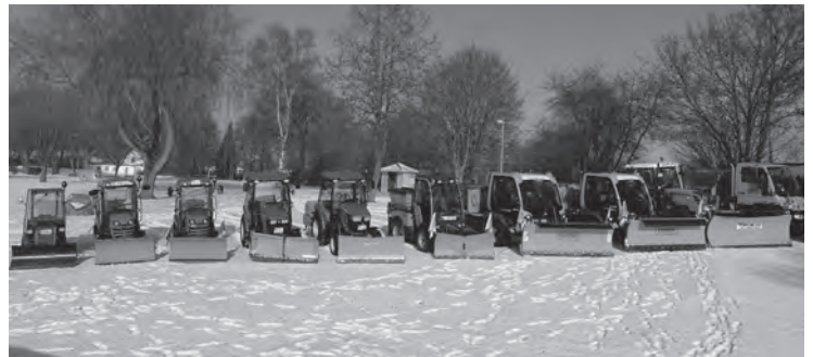
Unsere Flotte für den Winterdienst