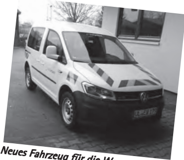
Neues Fahrzeug für die Wasserversorgung