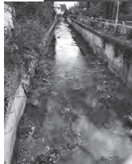
Ausräumen des Erlenbachs