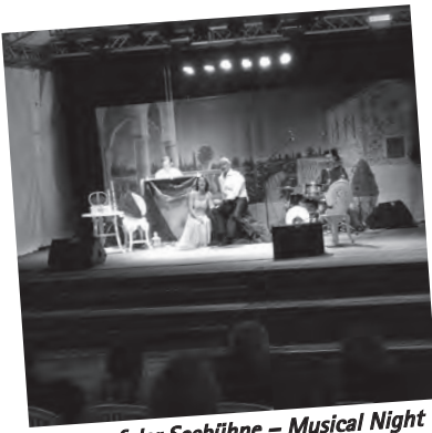
Kultur auf der Seebühne – Musical Night