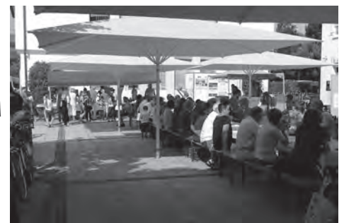
Fairtrade-Frühstück auf dem Marktplatz