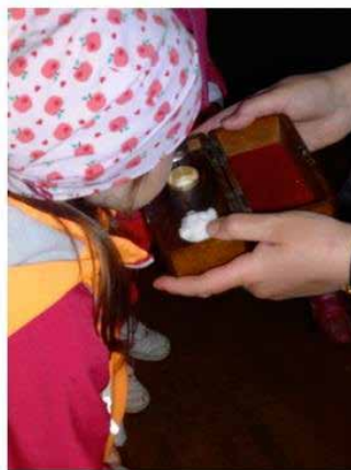
Riechen am Chrisam