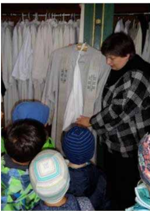
Die Kleider vom Pfarrer