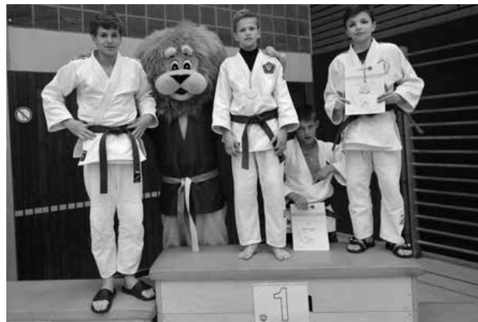
Erbacher Judoka zusammen mit Leo dem Württembergischen Judo-Maskottchen