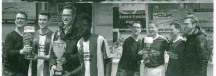
oben: Aktive u. AH SV Ringingen