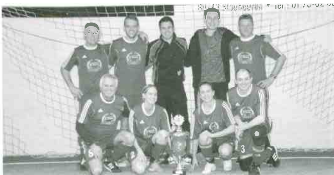
„Lindawirts“ Sieger Hobbyturnier