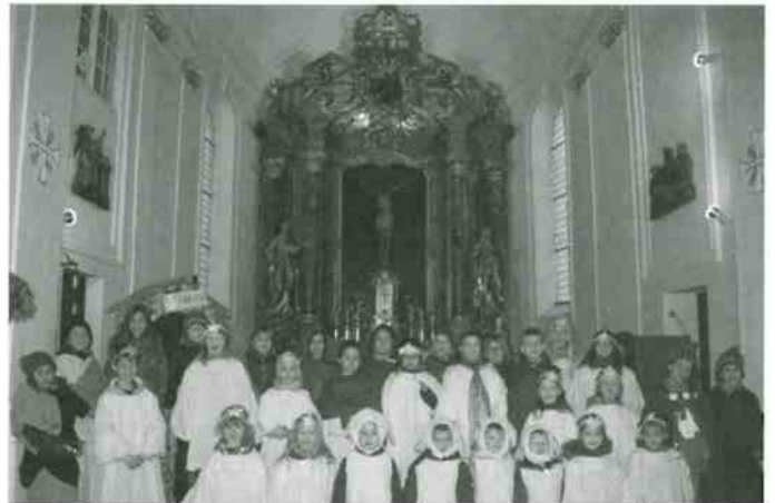
Kath. öffentl. Bücherei Ringingen