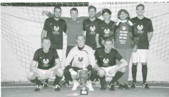
„Hoba Crew“ Sieger der Aktiven

Wir freuen uns bereits auf die Neuauflage im nächsten Jahr und hoffen, alle Teams und Fans wieder begrüßen zu dürfen.