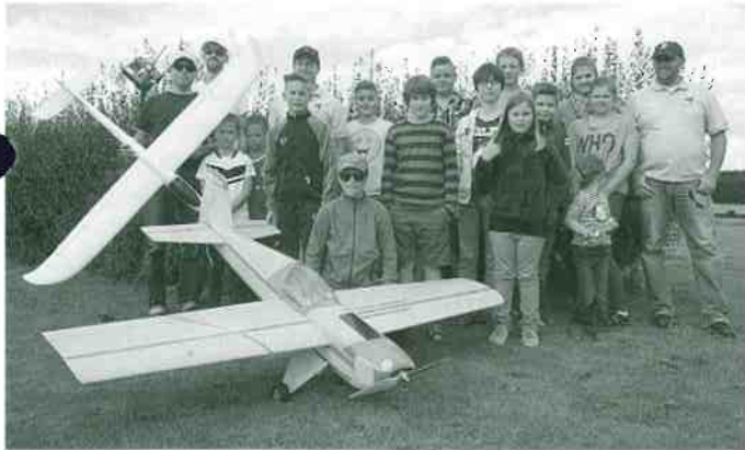
Schülerferienprogramm von 2014

Das Ganze findet auf unserem Modellflugplatz in Ringingen statt! Anfahrt siehe http://mfgerbach.de/html/flugplatz/flugplatz_anfahrt.html