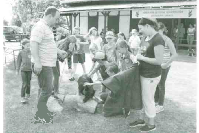
Kindernachmittag in der Ortsgruppe Erbach