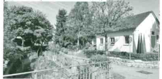
Der Bereich „Auf der Wühre“ heute

Auch die Ergebnisse aus den Bürgerwerkstätten zum Verkehrskonzept 2030 tragen zu der weiteren Gestaltung unserer Stadtmitte erheblich bei. Der Bereich der Erlenbachstraße nimmt im Rahmen des Verkehrskonzepts 2030 insofern eine Sonderstellung ein. Für die Neugestaltung der Erlenbachstraße wurden verschiedene Ansätze diskutiert, die vor allem für Fußgänger und Radfahrer deutliche Verbesserungen bringen sollen. Darüber wird der Gemeinderat in einer seiner nächsten Sitzungen entscheiden.