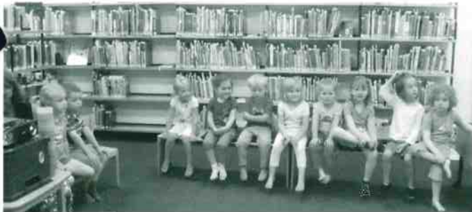
Kinderkino in der Bücherei