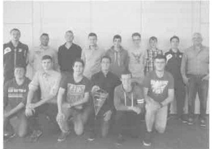
A-Jugend Meistermannschaft 2015