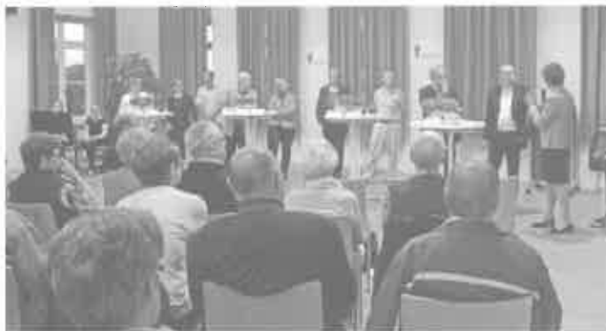
Bürgerhaus Allmendingen - Podiumsdiskussion

Wir haben aufregende und interessante Monate und Tage hinter uns. Die Hospizgruppe Donau-Schmiechtal feiert in 2015 ihr fünfjähriges Bestehen. Allemal ein Grund, den Feiern einen würdigen Rahmen zu geben. Es wurde ein Jubiläumsheft aufgelegt, das den Weg von der Gründung bis zur heutigen Arbeit aufzeigt. In Kürze wird dieses Heft in allen Rathäusern, Pflegeheimen, Arztpraxen, Kirchen und in anderen öffentlichen Einrichtungen ausgelegt. Anlässlich einer Pressekonferenz wurde eine Podiumsdiskussion im Bürgerhaus in Allmendingen angekündigt. Mit dem Thema "In Würde sterben" wurde zum Podiumsgespräch nach Allmendingen am 18.06.2015 eingeladen. Im Blickpunkt stand unter anderem die ambulante Palliativversorgung Schwerstkranker und Sterbender, damit Betroffenen ermöglicht wird, bis zuletzt in ihrem gewohnten Umfeld in Würde und mit kompetenter fachlicher Unterstützung zu leben. Mehr als 120 Besucher nahmen am Donnerstagabend an der Veranstaltung teil, die mit dem Impulsvortrag "Sterben und Tod heute" von der Ulmer Prälatin Gabriele Wulz startete. Pfarrer Gunther Wruck als Moderator kam nach und nach mit den Podiumsteilnehmern ins Gespräch, die aus ganz unterschiedlichen Erfahrungsbereichen den Zuhörern Ratschläge zur Sterbebegleitung gaben.