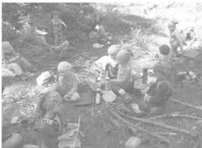
Picknick im Walde