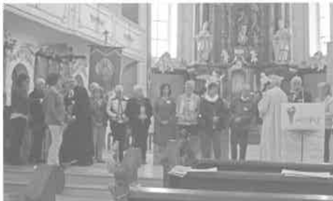
St. Martinus Erbach - Ökumenischer Gottesdienst