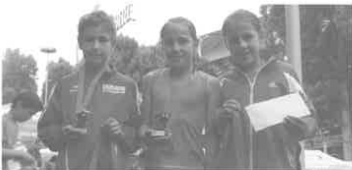
Erfolgreiche Erbacher in Stuttgart

Herzlichen Glückwunsch zu diesen tollen Erfolgen!