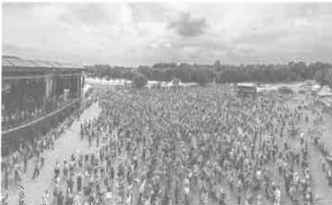
Gesamtspiel aller Festivalteilnehmer – Woodstock 2015

Am Samstag fand erstmals zum fünfjährigen Jubiläum ein "Gesamtspiel" aller Musiker auf dem Festivalgelände statt, welches sowohl Musiker als auch Zuhörer buchstäblich als ein musikalisches Donnerwetter erleben durften. Leider ließ das richtige "Donnerwetter" nicht lange auf sich warten und es schüttete anschließend wie aus Eimern. Der Stimmung tat dies überhaupt keinen Abbruch und so ging es kurz danach auf ziemlich matschigem Untergrund ganz normal weiter.