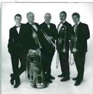
Elchinger Brass Quintett

Samstag, den 06. Juni 2015 um 18.00 Uhr, kath. Kirche St. Martin (Marktplatz 6, 89134 Blaustein)