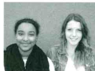
Die Schülersprecherinnen 2014/2015

Für euren großen Einsatz, nicht nur in Sachen Fair Trade, sondern auch in allen anderen in eurer Wahlperiode aufgetretenen Belangen, danken wir euch ganz herzlich!