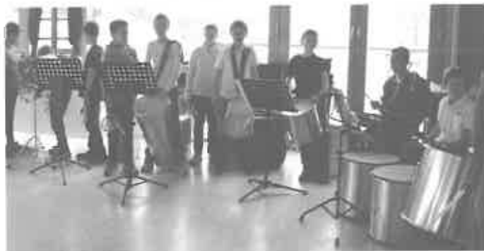
HGV Dank an Alle

... an alle Besucher während der beiden Tage „Erbacher Schaufenster 2015“. ... allen Ausstellern, Vereinen, den kulturellen und sozialen Bereichen, die erst eine Veranstaltung zum „Erbacher Schaufenster“ machen. Der Dank gilt auch der Stadt Erbach die dieses mit allen Abteilungen unterstützte und den Hallen- und Schulbereichen und dem Schulkollegium, um eine Veranstaltung in dieser Größe zentral durchführen zu können. Danke ... auch den Kollegen und Kolleginnen aus dem Organisationsteam und den Unterstützern sowie der EMS.