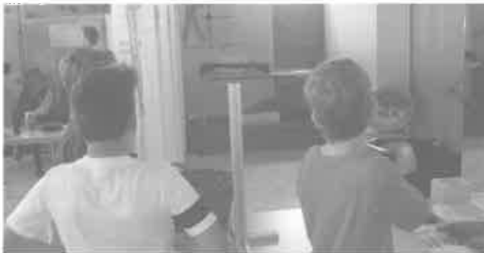
Unser Stand an der Leistungsschau

Herzlichen Dank an alle Besucher unseres Stands auf der diesjährigen Leistungsschau für das große Interesse.