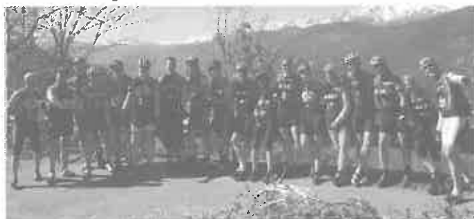
Radtrainingslager Ligurien 2015

Viel zu schnell war diese Woche vorbei. Gesamt: bis zu 760 km und 11500 hm. Super Truppe, super Urlaub, super Hotel, super Essen, super Wetter, super Landschaft, super Meer, super Mond, super ... Nächstes Jahr garantiert wieder!!!