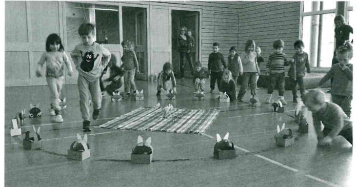
Osterfest in der Turnhalle

Bevor wir aber frühstücken konnten, mussten wir erst noch in der Turnhalle nachschauen ob der Osterhase bei uns war. Und tatsächlich – der Osterhase hat uns gefunden und jedem sein gefülltes Körbchen gebracht. Wir waren überglücklich! Danach haben lecker gefrühstückt und dann haben wir noch ein bisschen gespielt.