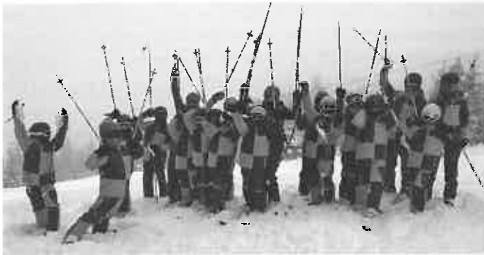
In neuem Outfit: Das Jugend Ski Team des TSV Erbach beim SkiCamp 2014

an Familie Geiges und das Trainerteam. Nächstes Skitraining von 23. – 25.01.2015 auf der Erbacher Skihütte.