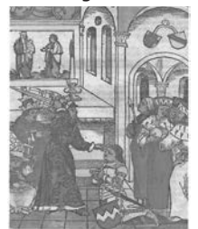
König Sigmund schlägt Bürgermeister Heinrich von Ulm zum Ritter

Heinrich von Ulm hieß der Bürgermeister von Konstanz, als 1414 das Konzil begann. Gegen Ende des Konzils schlug König Sigmund während eines feierlichen Hochamtes in Anwesenheit des Papstes Heinrich von Ulm zum Ritter.