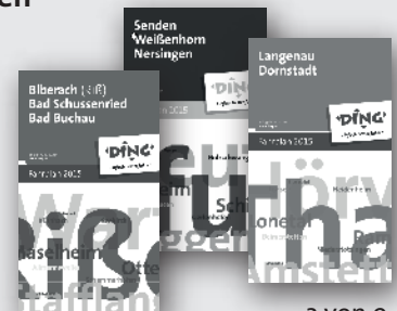
3 von 9: Die neuen Fahrplanbücher

(z.B. in Rathäusern, bei den Verkehrsunternehmen oder in Bahnhöfen mit personenbedientem Schalter).