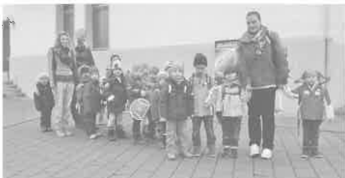
Die Theaterbesucher vor der Abfahrt

Diesen Monat besuchten die Kinder das Theater an der Donau und schauten sich das Stück "Der dickste Pinguin am Pol" mit viel Begeisterung an. Die geplante Zugfahrt nach Ulm musste auf Grund des Streikes entfallen. Doch die Fahrt mit den überfüllten Bussen des öffentlichen Nahverkehrs hat den Kindern, weniger den Erzieherinnen, sehr gut gefallen.