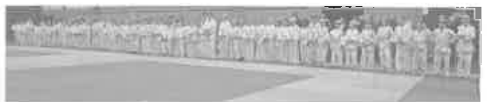
Das Bild zeigt die Jugend U10 und U12 beim Angrüßen

Über 100 Teilnehmer beim 22. Judo-Jugendturnier des TSV Erbach