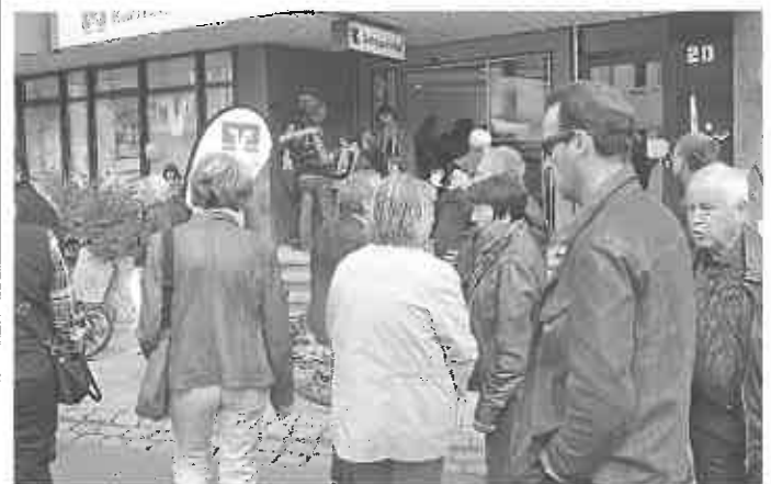
verweilen, informieren, kaufen, spielen

Die kulinarische Vielfalt, geboten auf dem Rathausplatz und beim Kreisel an der Sparkasse, stillt bestimmt jedermanns Gelüste. Wie das Weißbrotfrühstück, vegetarische Burger, frische Crepes und Holzofendinnete über Kaffee und Kuchen bis hin zu Fischvariationen und Original Thüringer ein breit gefächertes Angebot.