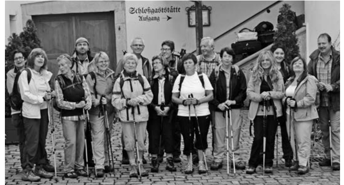
Wandergruppe am Schloss Fürsteneck

Bei der Anreise am Sonntag in Spiegelau erwartete die 17 Wanderer bestes Wanderwetter.