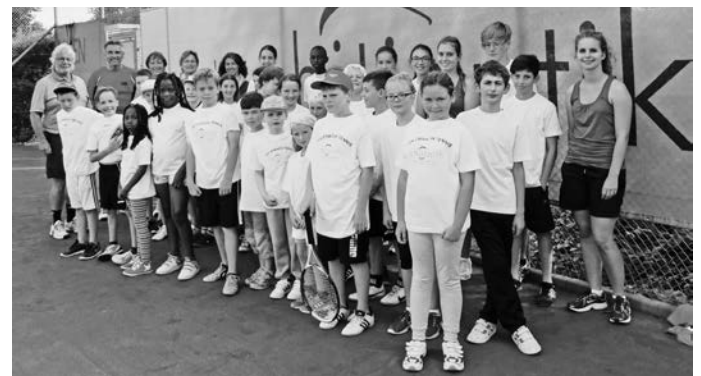
Ein gelungener Ferien-Nachmittag!

Ein dickes Dankeschön auch an unsere Betreuer!