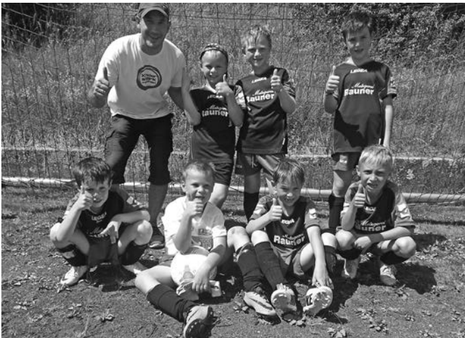
So sehen Sieger aus !!!