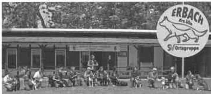
Teilnehmer Frühjahrsprüfung Teil II