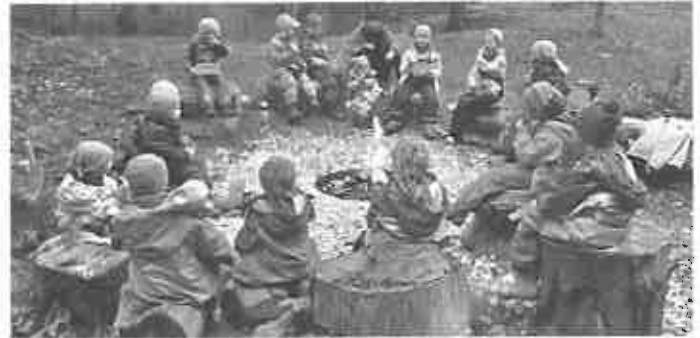
Unsere Waldtrolle (Alter ab 3 Jahre)