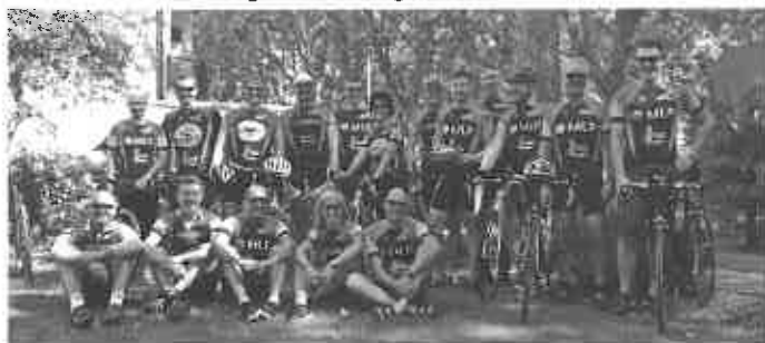
Bergziegen und Landschaftsgenießer 2014

Im Ziel gab es dann die obligatorische Pasta mit Bier und als besonderes Schmankerl diesmal brasilianische Sambatänzerinnen - damit auch das Auge was zu regenerieren hat!