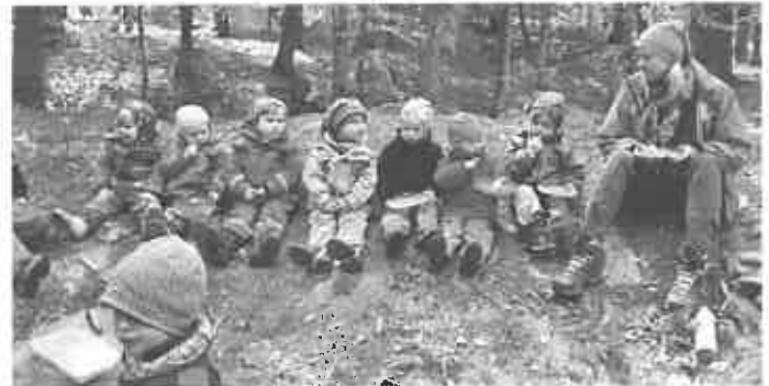
Unsere Wurzelkinder (Alter 2-3 Jahre)