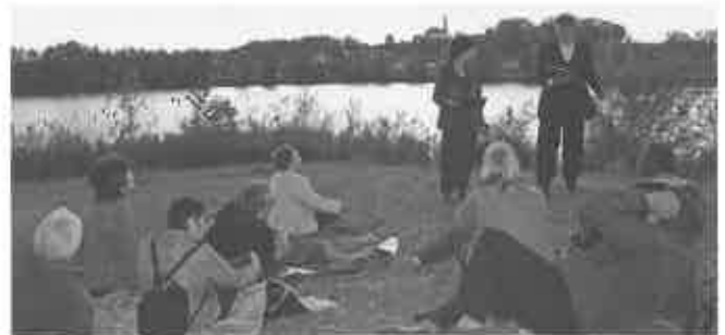
Lesung mit Blick auf See und Erbach