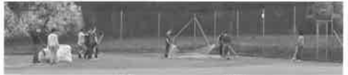
Danke an die zahlreichen und fleißigen Helfer und Helferinnen