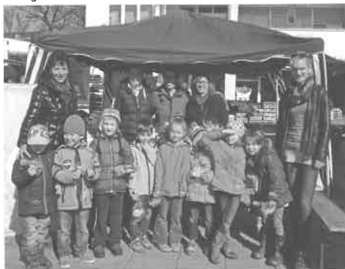
Unsere großen Kleinen besuchen ihren Verkaufsstand

Dafür möchten wir allen Beteiligten und vor allem unserer kaufkräftigen Kundschaft recht herzlich danken.