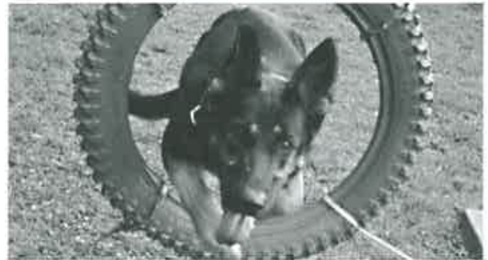
Spiel und Spaß beim Fungility!

Bei Rückfragen bitten wir um telefonische Kontaktaufnahme mit Renate Luigart: 07305 - 23247