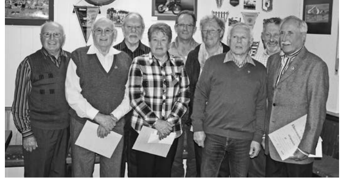
Jubilare mit 50- u. 60-jähriger Vereinstreue zum TSV Erbach

In schöner und harmonischer Atmosphäre fand am Samstag, den 22.03.2014 die Mitglieder-Ehrung langjähriger Mitglieder des TSV Erbach 1911 e.V. im Sportheim statt.