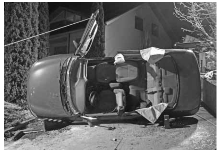
Das Dach wurde vom PKW entfernt, um den Fahrer zu retten

Wir bedanken uns bei den Anwohnern der Hetzengasse/Bei den Quellen in Ringingen für ihr Verständnis für die Lärmbelästigung am späten Abend und das entgegengebrachte Interesse für die Tätigkeit ihrer Feuerwehr.