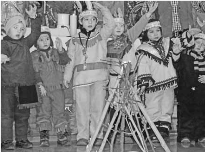
Narrenmesse des Kindergartens mit den Spuler Weibla

Danken möchten wir auf diesem Weg den Spuler Weibla, dass sie mit uns am Samstag, den 08.02.2014 diesen tollen Fasnetsgottesdienst gefeiert haben.