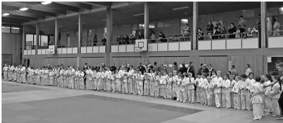
U10-Judokas bei der Begrüßung