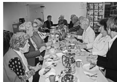
Rege Unterhaltung an der Kaffeetafel des Seniorentreffs in der Stadtbücherei