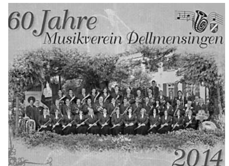
Titelblatt Kalender 60 Jahre Musikverein Dellmensingen

Machen Sie sich selbst oder jemandem ein einmaliges und besonderes Geschenk! Vorstandschaft