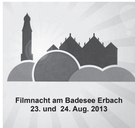
Filmnacht am Badesee Erbach 23. und 24. Aug. 2013